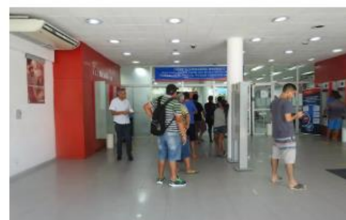
Além dos pontos especiais, abertura de contas também pode ser feita nas agências do Bradesco

Foi ampliado a partir desta segunda-feira (6) o horário de atendimento nos postos do Bradesco para abertura de contas dos servidores estaduais da Paraíba. Os servidores podem contar com o atendimento nas unidades especiais montadas em João Pessoa e Campina Grande de segunda a sábado, das 7h às 19h (horários locais).